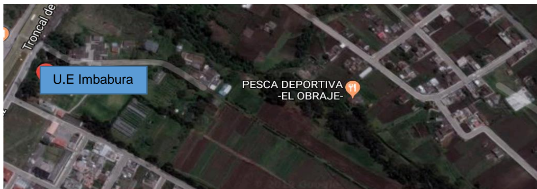
Gráfico N°1 Delimitación geográfica de la U.E Imbabura

En materia de estructura física, la institución cuenta con una infraestructura de cemento armado y estructura metálica con techo de zinc. Las aulas se componen de un pizarrón y mesas escolares. Sin embargo, estos artículos se encuentran deteriorados y las cubiertas no se encuentran en condiciones óptimas Juan Pérez, comunicación personal, 10 junio 2019.