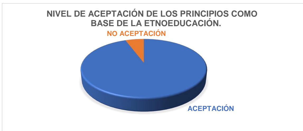
Gráfico 1: Nivel que aceptación de los principios como base de la etnoeducación