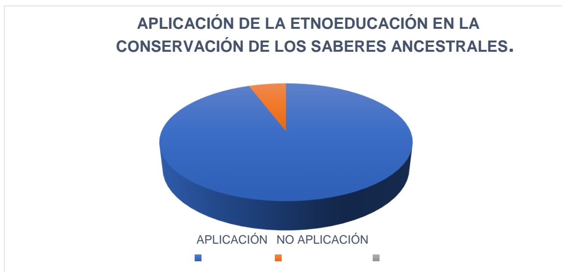
Grafica 2: Aplicación de la etnoeducación en la conservación de los saberes ancestrales.