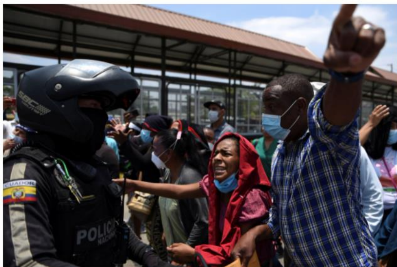
Familiares de los presos piden información de los suyos a los policías en los alrededores de la cárcel de Guayaquil.