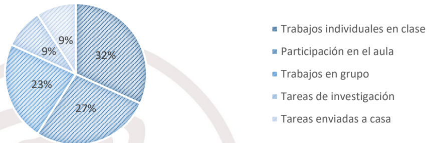
Gráfico 2: Nivel de participación de los estudiantes en la construcción del aprendizaje.

Al considerar el nivel de participación de los estudiantes en la construcción del aprendizaje los docentes identificaron que las dificultades de mayor prevalencia fueron: