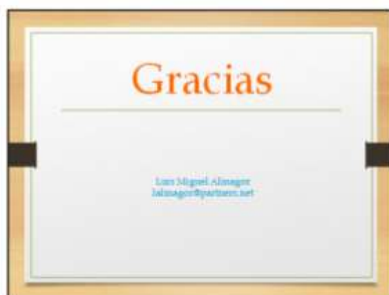
Imagen 4

Las Diapositivas serán presentadas al momento de capacitar al personal del GAD Municipal de como debe ser el proceso de registro y el cumplimiento de requisitos previos a la aprobación del trabajo de los adolescentes por cuenta propia.